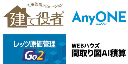
▲ データ連携可能な他社システム

A's と完全連携する弊社製営業見積システム「madric success（マドリックサクセス）」では、「建て役者」「AnyONE（エニワン）」「レッツ原価管理 Go2」といった、他社製の基幹システムとデータ連携できます。見積から実行予算・原価・発注・入出金などの業務フローを確立することで、適切な価格設定や利益確保につながります。さらに、A's の CAD データコン