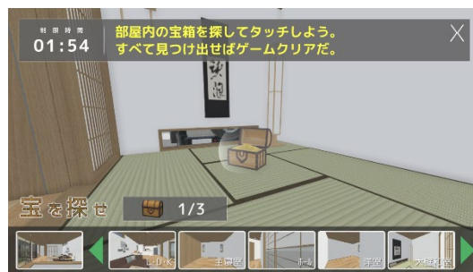
▲ A's 3D Player の宝探しゲーム

A's で作成した 3D 住宅をスマホで自由にウォークスルーできるアプリ (A's 3D Player : エース スリーディ プレイヤー) に、宝探しゲームが登場します。遊び要素を含んだゲーム形式で楽しみながら住宅を確認できるツールとして、お客様との話題作りやお子様同席の打ち合わせ時にも便利です。宝発見時のメッセージは自由にカスタマイズできるため、住宅や部屋の特徴をアピールすることもできます。