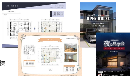
▲ プレゼンボードと WEB 広告のテンプレートデザイン

プレゼンボードの作成機能「A's デザイナー」では、プレゼンボード用のデザインテンプレートが用途別に計 61 点追加されます (小屋裏用、リフォーム用など)。また、Instagram などの SNS で見学会の案内を行う際に使用できる WEB 広告用テンプレートデザイン 5 点も追加され、お客様への提案や WEB 活用の幅がさらに広がります。